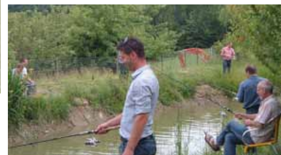
Photos reflétant l'atmosphère du concours de pêche qui a précédé l'assemblée générale

ISOLSUISSE Suisse centrale est présente au