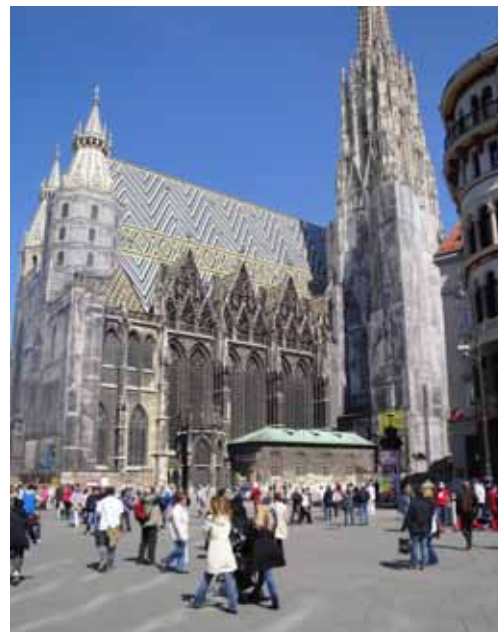
La FESI invitée à Vienne

Le congrès mondial des associations d'isolation WIACO se déroulera du 19 au 21 septembre 2012 à Paris. Le programme sera très varié, la soirée de gala se déroulera au «Moulin rouge».