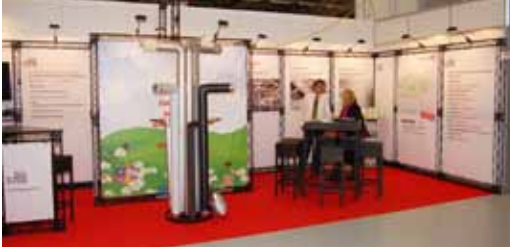
Un stand ISOLSUISSE attrayant sur une surface de 24 m2

PD/ Le 10ème salon suisse de la maison et de l'énergie, qui s'est déroulé du 24 au 27 novembre, a rencontré un écho extrêmement positif en accueillant près de 25'000 visiteurs et plus de 400 exposants. ISOLSUISSE a également été de la partie. Conjointement avec la BIV (Association des entreprises d'isolation bernoises), notre association de branche s'est présentée aux spécialistes et au public intéressé.