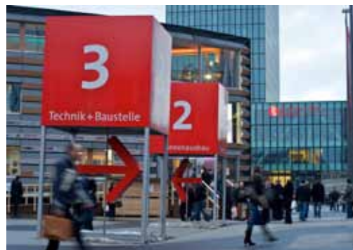
Swissbau ouvre la voie au marché du bâtiment

Parallèlement à l'intégration de l'ancien salon Hilsa, Swissbau peut se prévaloir d'autres premières: la série de manifestations « Swissbau Focus » est consacrée à la construction et à la rénovation durables. Dans l'« OfficeSpace », les exposants présenteront des innovations autour du bureau et des locaux commerciaux publics. Et dans « Tendances cuisines », les visiteurs découvriront les cuisines de l'avenir, dans lesquelles on ne se contente plus de cuisiner. Swissbau se déroulera au Centre de congrès de Bâle du 17 au 21 janvier 2012.