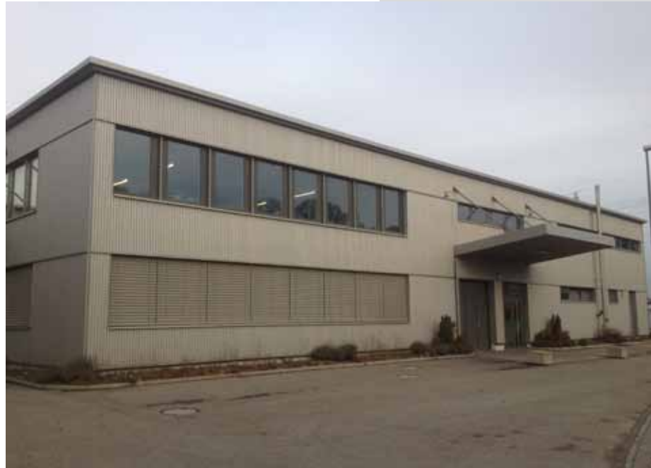
Notre nouveau centre de cours situé Mossrainweg 8 à Münchenbuchsee (BE)

Nous disposons ainsi à tout moment de notre propre atelier, et ce avec des conditions favorables, à l'intérieur d'un bâtiment industriel plus récent.