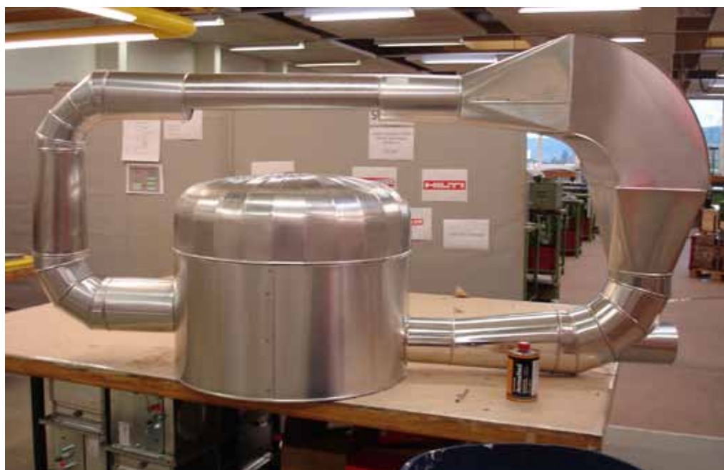
Pièce expérimentale réalisée en 3ème année d'apprentissage dans l'atelier isolation et tôle

C'est grâce à leur aide que les cours peuvent être organisés sous cette forme. K. Maurer